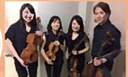
群馬交響楽団員による弦楽四重奏