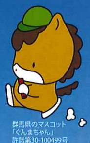
群馬県のマスコット 「くんまちゃん」 許諾第30-100499号