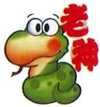
老神温泉キャラクター じゃおうくん

※天候その他の事情により、イベントプラン並びにウォーキングコースを変更させていただく場合があります。